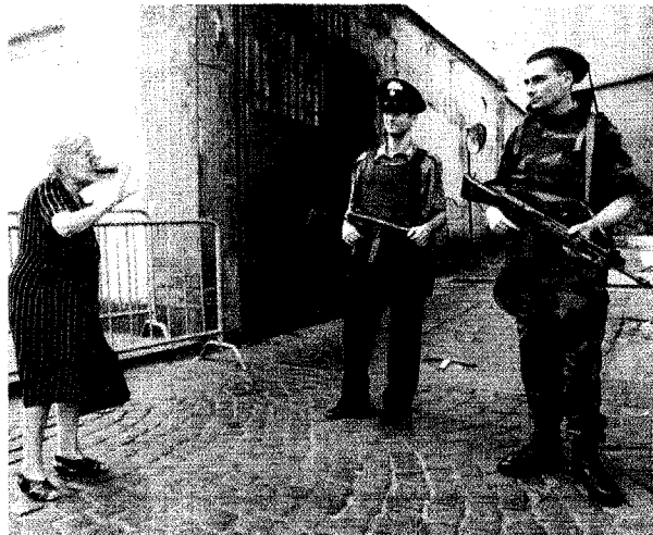
SICUREZZA. Da lunedì polizia e carabinieri saranno affiancati dai soldati: in questa foto d'archivio i militari in strada a Napoli nel 1997

IMMIGRATI | Rom, l'Europa contro l'Italia Militari nelle strade anche a Bari Foggia e Brindisi