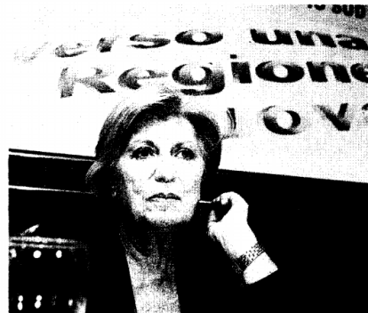
IN POLE POSITION Il sottosegretario Alfredo Mantovano e la senatrice («Io Sud») Adriana Poli Bortone