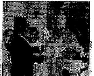
Lo scambio di doni

Un mese è passato dai giorni della festa, le piogge cadute copiose hanno provocato i soliti danni, costringendo le donne e gli uomini di San Luca ad aprire varchi e rattappare fonditure. La strada della legalità è tracciata, quella per Polsi, purtroppo, ancora no.