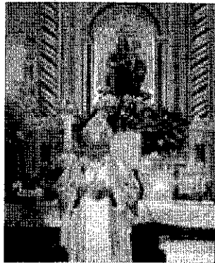
Il vescovo durante la sua omelia

Locri, ha invocato anche sui «dirigenti ed agenti della polizia di Stato la protezione materna della Vergine Maria e del patrono celeste affinché possano generosamente compiere la propria attività con spirito di servizio», imparando dal presule e a tutti coloro che hanno partecipato alla messa la benedizione Apostolica.