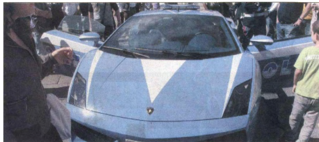
La Lamborghini in mostra in piazza Sant'Oronzo

Era già gremita dalle prime ore della mattina, piazza Sant'Oronzo a Lecce, dove ieri sono cominciate le celebrazioni per la ricorrenza di San Michele Arcangelo, patrono della Polizia di Stato.