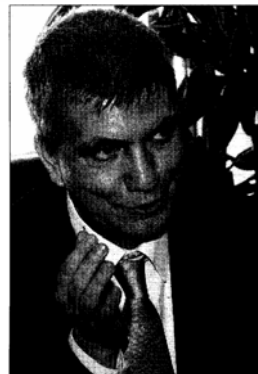
Nichi Vendola, presidente della Regione Puglia

Alfredo Mantovano, sottosegretario all'Interno, è tanto sintetico quanto tranciante: «Vendola ha una buona dose di spregiudicatezza politica che gli permet-