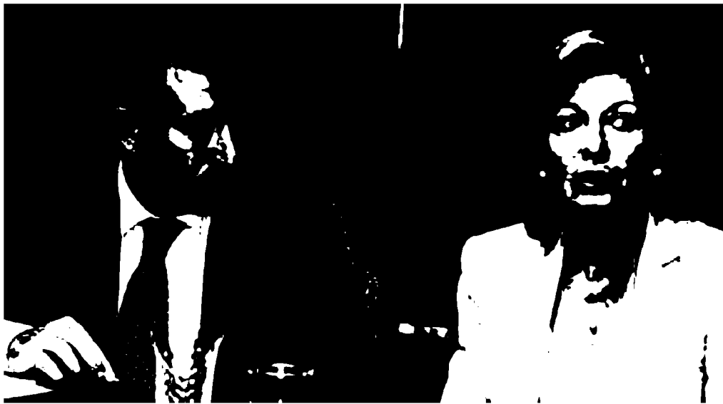
Il sottosegretario all'Interno, Alfredo Mantovano, e la sindaca di Lecce, Adriana Poli Bortone

Il sottosegretario: «Ritirerà le dimissioni, cosa aspetta a dirlo?». E lei: «Non replico, rifletterò ancora»