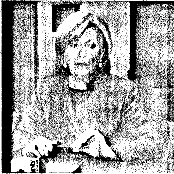
Adriana Poli Bortone