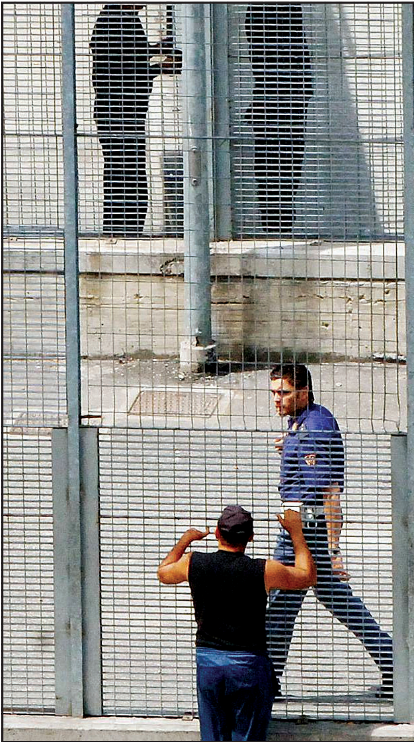
EVASIONE Il centro di accoglienza temporanea di Torino

Un problema per la coalizione che appoggia il governo di Romano Prodi visto che comprende anche esponenti e partiti che nel recente passato hanno chiesto la loro abolizione. Lo ha fatto recentemente Francesco Caruso di Rifondazione comunista secondo il quale «se il ministro dell'Interno Giuliano Amato non ha ben chiaro che bisogna chiudere i Cpt, credo che per schiarire meglio le idee a lui e a tutta la coalizione è necessario costruire forme anche radicali di mobilitazione, azioni di disobbedienza che mettano in luce l'illegalità di questi luoghi, di questi lager». Lo ha fatto l'europarlamentare dei comunisti italiani Marco Rizzo e anche la collega di partito Manuela Palmieri che ha presentato una mozione proprio per abolire i centri di accoglienza degli immigrati. Un problema anche per il governo visto che le competenze sui Cpt sono contese dal Viminale,