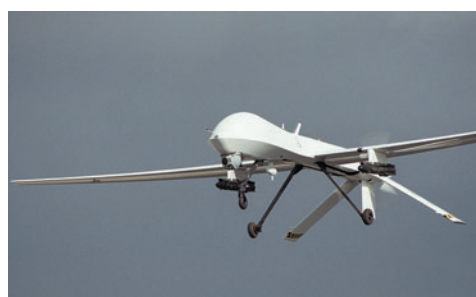
DRONI Un aereo robot nei cieli degli Usa

I pattugliamenti con aerei senza pilota fanno parte di un programma da 1,4 miliardi di euro voluto dalla Commissione europea per equipaggiare le forze di polizia europee, gli addetti alle dogane e le pattuglie di frontiera con strumenti ad alta tecnologia. Il velivolo, denominato Uav - Unmanned aerial vehicle - è già in uso dal governo belga per l'intercettazione di tanker che sversano illegalmente petrolio nel mare del Nord. Numerosi capitani sono già stati legalmente perseguiti. «La Commissione europea - scrive il giornale - ora vuole usare simili droni, che possono avere un'apertura d'ala di sei metri e pesare so-